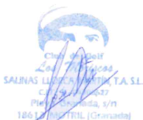
Club de Golf Los Moriscos Sello y Firma

Es imprescindible para los interesados presentar el carnet del Club, estar en posesión de licencia federativa y se someterán a las normas y reglas vigentes en cada Club.